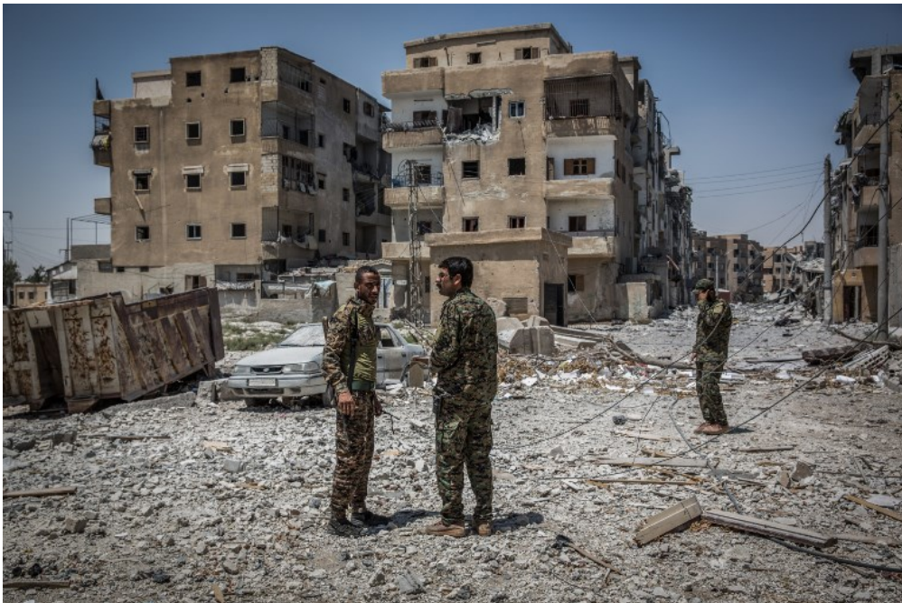
La majorité de la ville de Raqqa, en Syrie, a été détruite pendant la bataille contre les djihadistes de Daesh.

1jour1actu t'explique en quoi la perte de Raqqa est une véritable défaite pour Daesh.